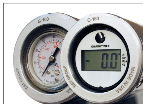
Medidores analógicos y digitales opcionales